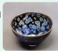
東京・静嘉堂文庫美術館

現在、福岡市美術館で開催されている『藤田美術館の至宝 国宝曜変天目茶碗と日本の美』展で、この稀代の茶碗が展示されます。写真や画像ではなかなか分かりづらい「曜変」を目にするチャンスです。しかも通常の照明ではなく、LED(発光ダイオード)ライトを用いた展示を行うとのこと。果たして700年の時を経た器は現代の光の下でどのように輝くのでしょうか…？尚、実物は高さ7cm程のこぶりなもの。じっくりご覧になりたい方はぜひ単眼鏡などお持ち下さい。