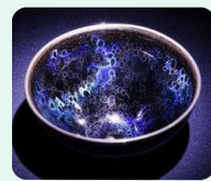
大阪・藤田美術館