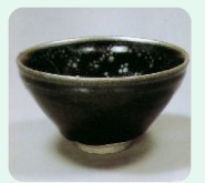
京都・大徳寺龍光院